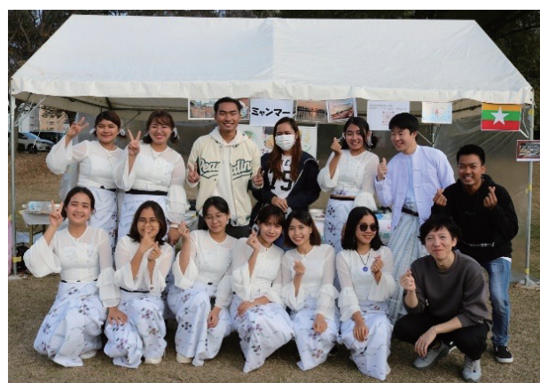
地域における国際イベント