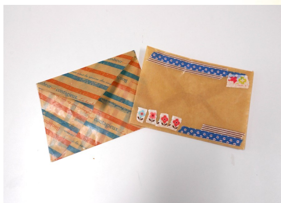
⑥ 飾りのシールを貼ったら完成!!