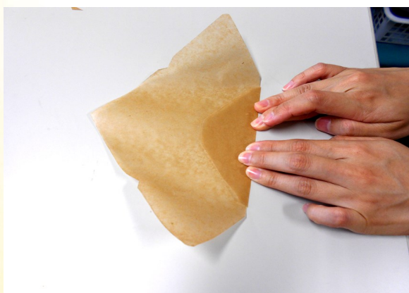
③ ②で切った紙の下部分を山折りする。