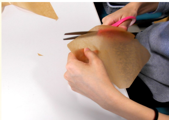
② ①でなぞった線の通りにハサミで切る。