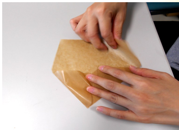
④ ③で折った部分に少し重なるように左右の部分も山折りする。