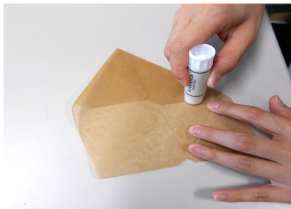
⑤ 紙が重なる部分に糊をつけて貼る。