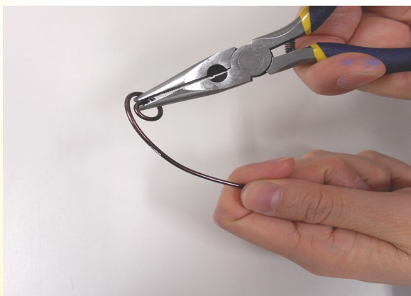
③ ワイヤーを適度な長さに切り、写真のように、先をうずまき状に丸める。