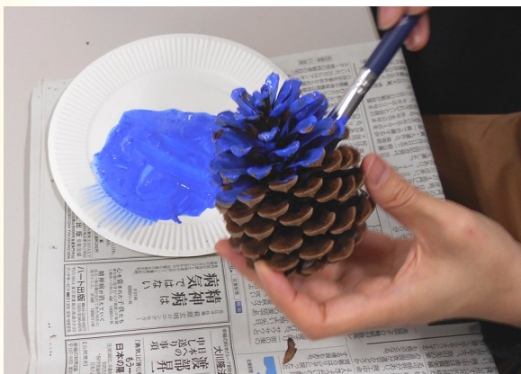
② 絵の具で色をつけ、乾燥させる。