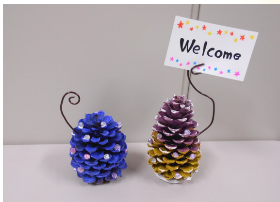
⑥ ワイヤーにメモをはさんだら完成!!