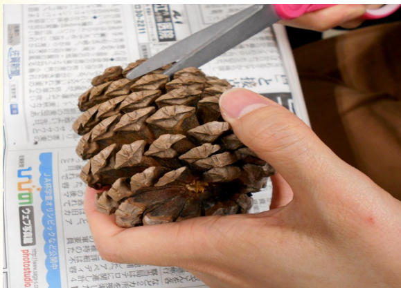
① 松ぼっくりのとげをハサミで切る。