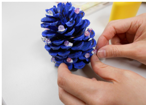
⑤ ボンドを使い、飾りのビーズを貼る。