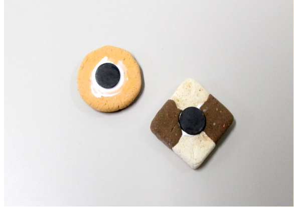
④ 粘土が乾く前に、裏にマグネットを埋め込む。 その際、木工用ボンドを使うと外れにくい。