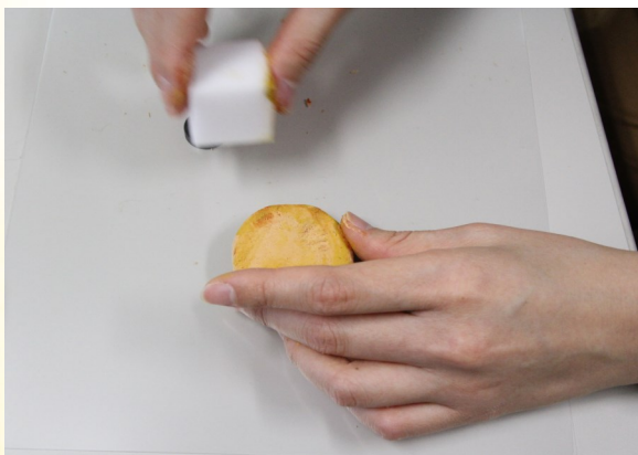
③ スポンジに絵具をつけて色をつけると 本物そっくりになる。