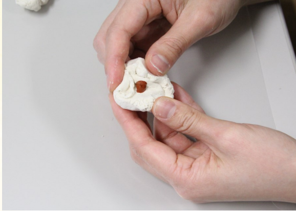
① 紙粘土に絵の具を混ぜて色をつける。