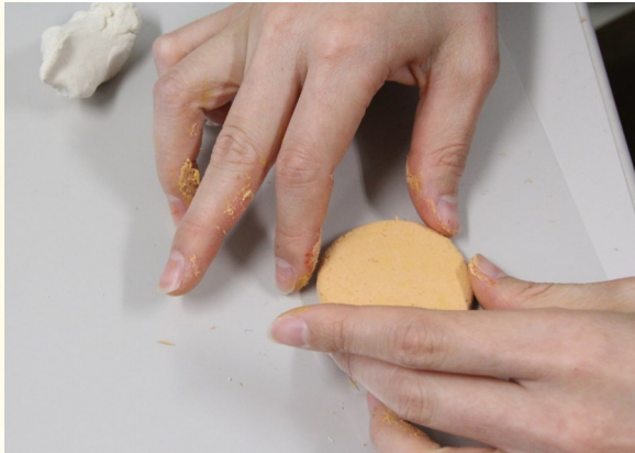
② 色が付いたら、好きな形に整える。