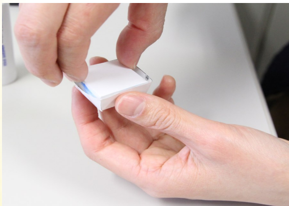
③ チョコ型パーツの中に裏カバーパーツを入れてのりやテープで固定する。