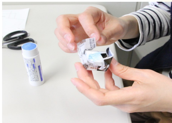
⑤ 側面と裏面も包装紙で包むように貼る。