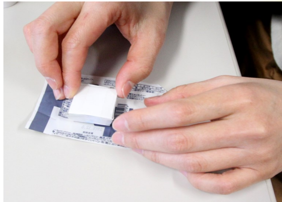
④ ③の表面にのりをつけ、包装紙に貼る。