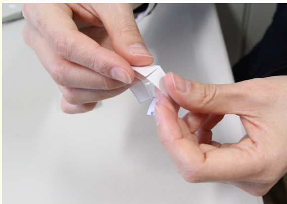
② 型紙の線通りに折り曲げ、端をテープで固定する。