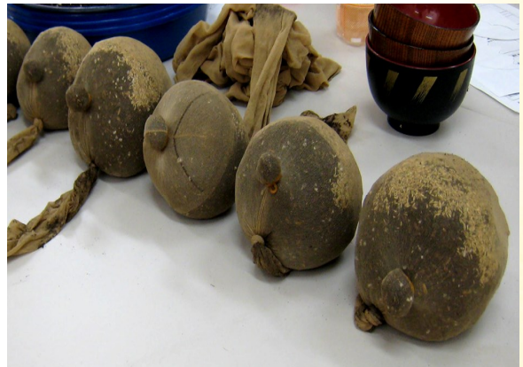
⑤ 鼻を作り、輪ゴムで留める。目と鼻をボンドでつける。