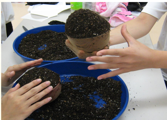
③ お椀に土を入れる。