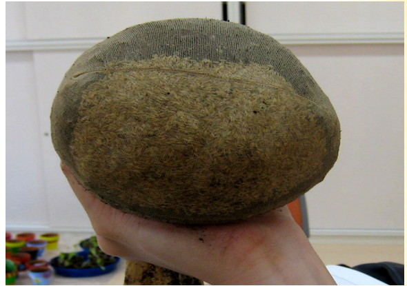
④ お椀から外して丸める。