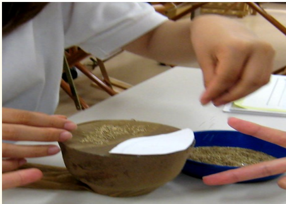
② 頭になる部分に種を置く。全面に種を乗せないよう注意!!