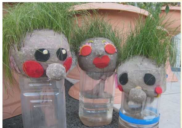
⑥ ペットボトルで作った体に頭を乗せる。