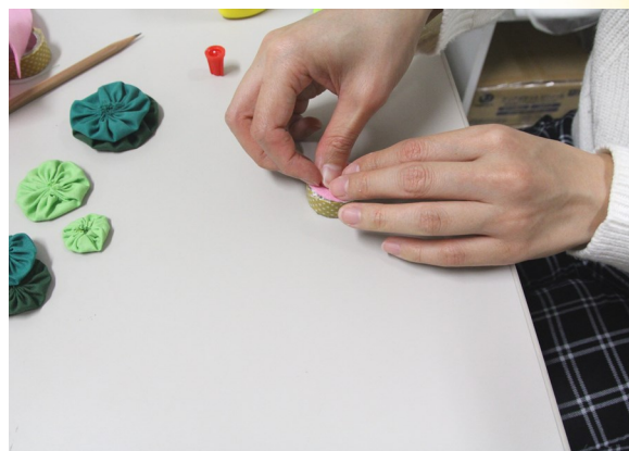
④ ペットボトルのキャップに綿を詰め、フェルトを被せる。