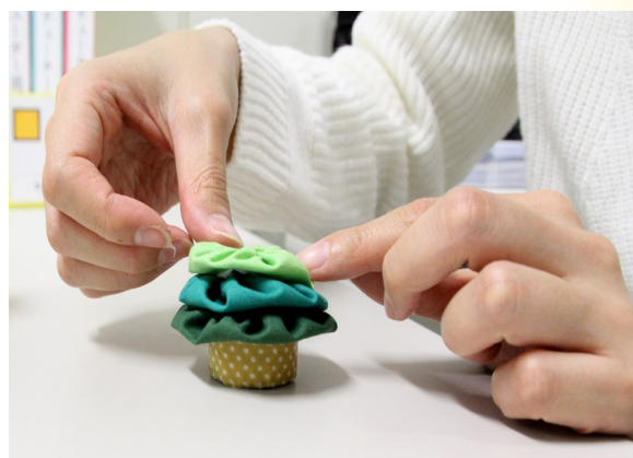
⑤ ④のキャップの上に、③を順番に重ねる。