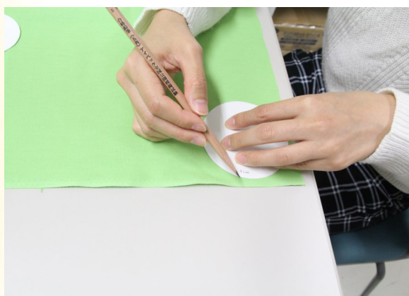
② 型紙に沿って印をつけ、ハサミで切る。