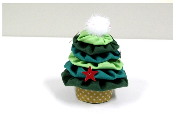
⑥ 好きな飾りをつけたら完成！！