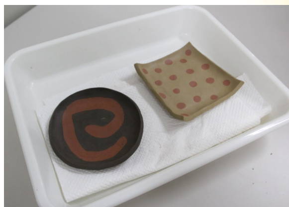
⑤ 1週間ほど乾燥させ、オーブンで焼く。 (この工程はスタッフが行います)