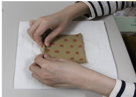
④ 端を内側に反らせ、形を整える。