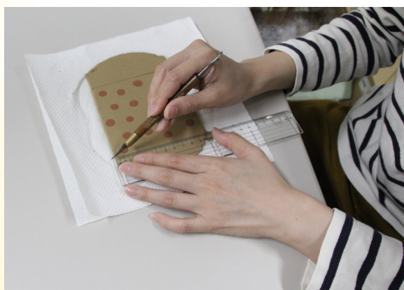
③ 10cm×10cmの大きさに印をつけて切る。 ※刃物を使うので、ケガに注意!!