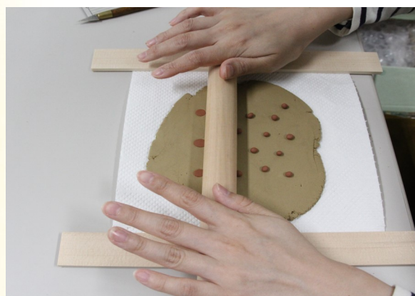
② ①で伸ばした土の上に、違う色の土を置き、麺棒で伸ばす。