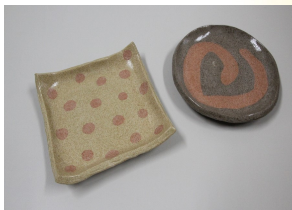
※ 柔らかいスポンジでやさしく洗って下さい。 ※ 電子レンジ・オーブン(トースター含む) 食器 洗い機は使用できません。