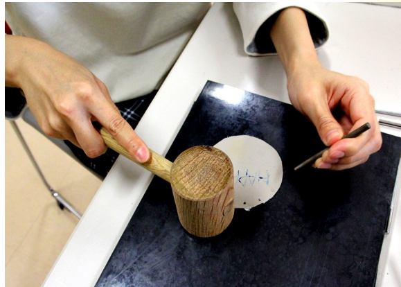
④ 縁のところに穴をあける。