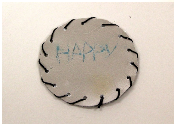
⑤ 糸を裏側で結んだら完成!!