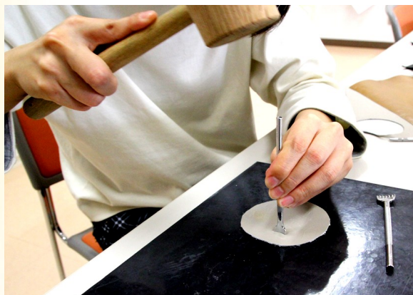
② 好きな模様や文字を刻印する。