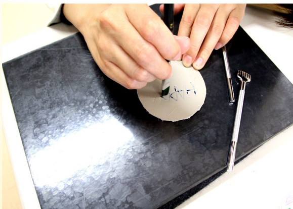
③ 染料で色をつける。