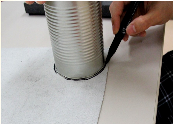
① 革に印をつけて切る。