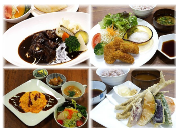
おすすめランチ例

季節に応じて仕入れた食材でご提供するシェフのおすすめメニューです。 内容は店内のお知らせをご覧ください。