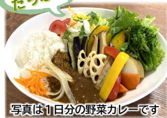
写真は1日分の野菜カレーです