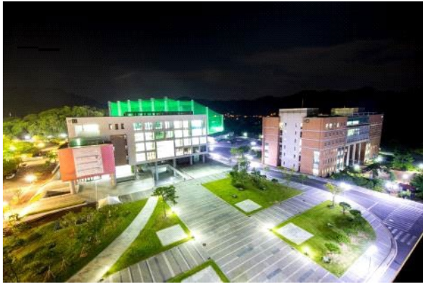
建国大学グローバルキャンパス