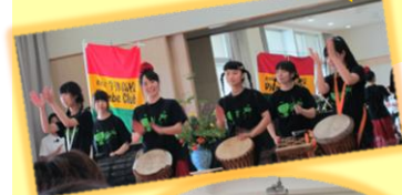
牛津高等学校 ジャズ部のみなさんによる演奏