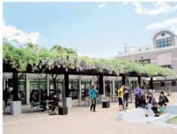
(学生ホール-正面写真)