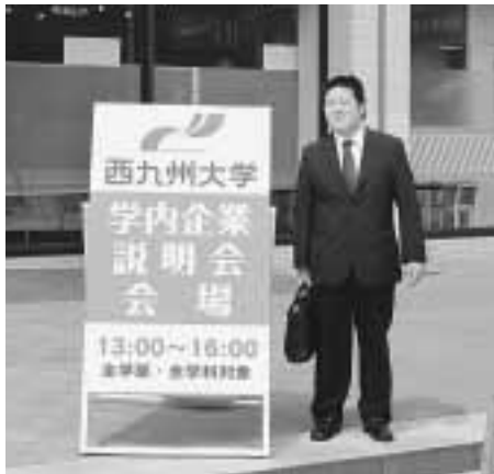
写真①: 当日は全員リクルートスーツで参加。スーツの着こなしも、今後の課題です(笑)。

2年次から行ってきた就職支援講座の総仕上げとなるものです。夏場に向けての就職活動の展望と対策(企業研究の徹底、自己PRの徹底、履歴書作成の7つのコツ、面接対策、エントリーシート記載のコツとツボ、自分に合った仕事探し、これから間に合う選考試験他)について、学生は一つずつ確認していました。