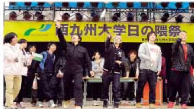
(日の隈祭、ステージの様子)