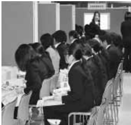
写真②: ドキドキしながら、ブースに並び、説明を聞きました。