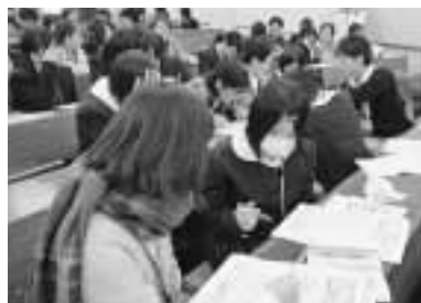
学生との意見交換が好評でした。

平成23年は10月29日に「第3回 ふくフェス in 西九」等を予定しています。