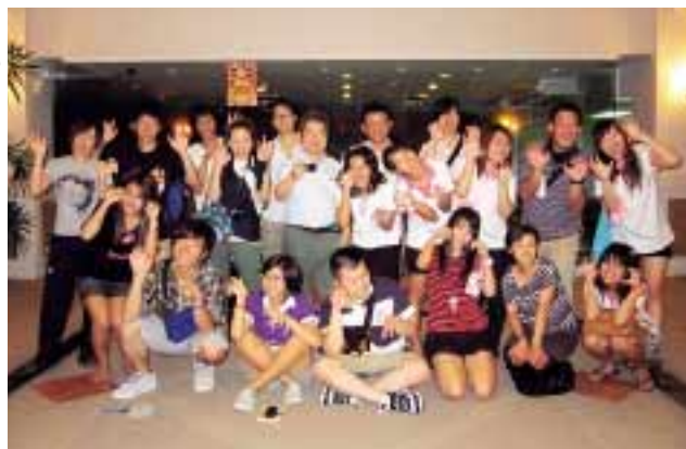
写真① 歓迎会での一コマ

学ぶことができたと思います。今回の国際交流活動では、得たものはとても大きく、外国でのレクリエーションや発表を経験し、言葉が通じなくても、ジェスチャーや顔の表情でお互いの気持ちを伝え、コミュニケーションを図ることができるといふこと、実際に経験し感じることで、とても自信となりました。また、異なった文化に触れ、自身の視野が広がったと感じています。また何より、外国に連絡を取り合う友達ができたことが、とても嬉しかったです。今回の経験が、社会人となってからも活かせると思います。そして、皆さんもたくさんの方へチャレンジしてみてください。