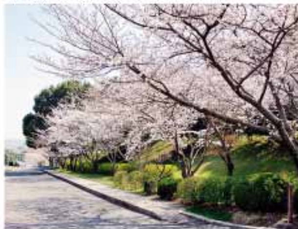
(スクールバス停前の坂道)

【スポーツ系サークル:アルティメット】 アルティメットは、フリスビーのディスクを使い、7人でディスクをまわしながら落とさずに相手の陣地でキャッチし、その獲得数が多いチームが勝利というニュースポーツです。大学から始める人がほとんどなのと、風の影響でディスクがどんな動きをするか分からないところが魅力です。福岡や熊本などで大会が行われており、男女で分かれて行う試合や混合の場合もあり、どんな人でも楽しめるスポーツです。サークルの皆も男女、学年関係なく、楽しく、そして一生懸命に練習を行っています。