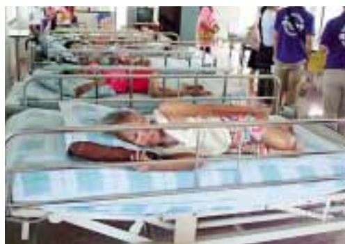
写真② 障害者施設での入所者の生活の様子